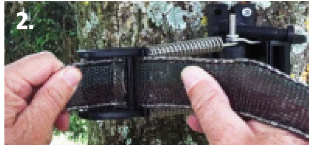
2. Repasser le ruban dans la plus grosse fente.