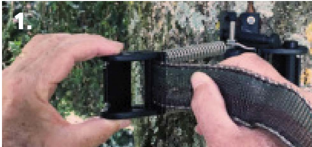
1. Insérer le ruban à travers la fente de la boucle plastique.