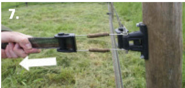
7. ... pour bloquer le rouleau.