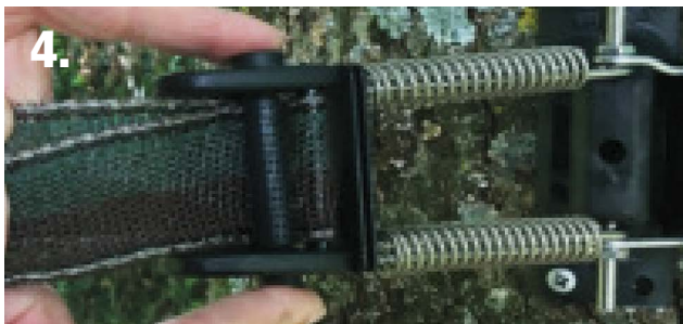
4. Insérer le rouleau au devant des 2 épaisseurs de ruban.