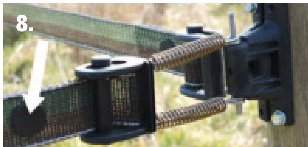
8. Placer un CLIP punaise pour attacher les rubans.