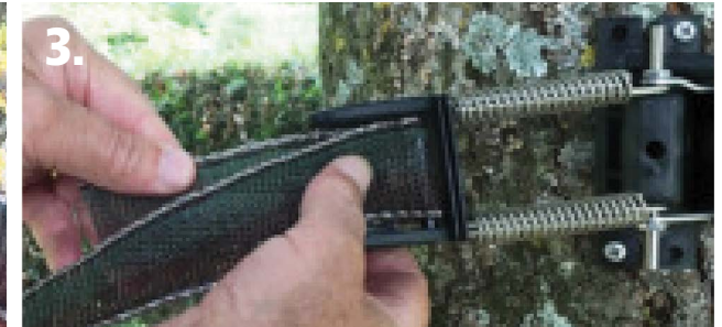
3. Pousser les 2 parties du rubans bien au fond de la boucle. La fin du ruban est à l'arrière.