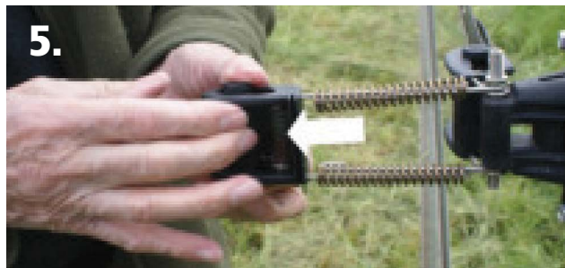
5. Tirer le rouleau pour pincer les 2 rubans.