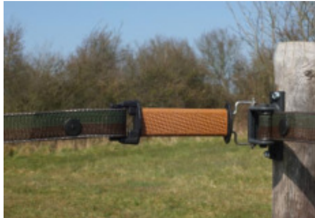
Tendeur #BP37 et poignée #BP13A avec clip #RCLIPbl

#BP37 sur piquet métal avec collier de serrage #HC