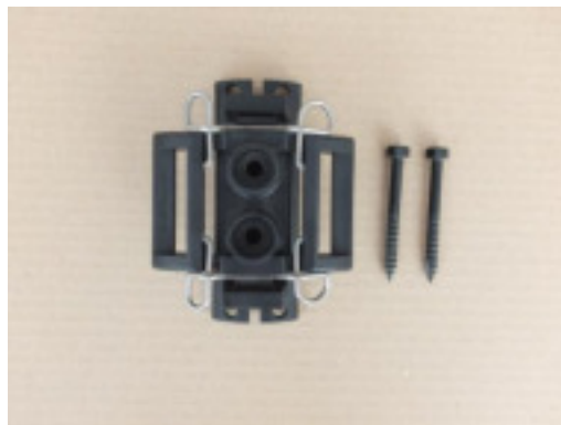
#BP32 +2 tirefonds #LB50 sur piquet bois