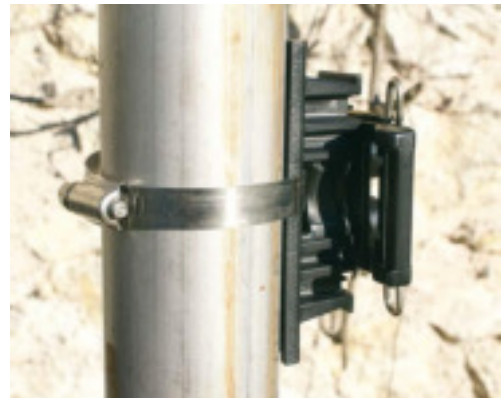
#BP32 avec collier de serrage#