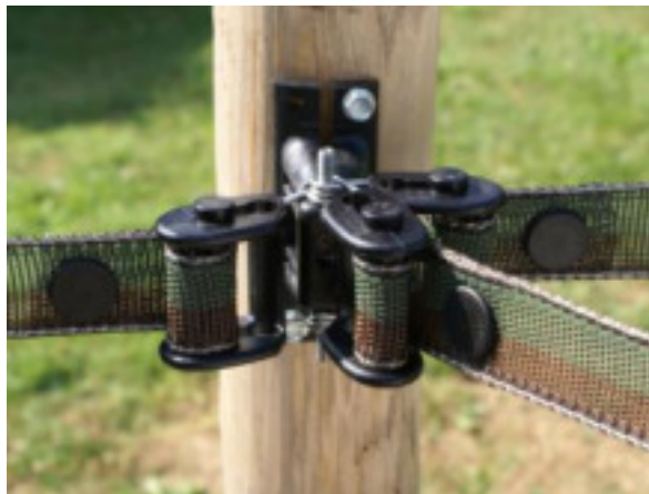
#BP37 avec #BP37T