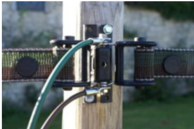
#BP37 avec câbles

La distance entre 2 tendeurs x #BP37 ne doit pas être supérieure à 1200 pi (350 m) cependant pour assurer de bonnes connexions, le ruban doit rester tendu et c'est pourquoi il est préférable d'ajouter un tendeur tous les 320 pi sur une ligne supérieure à cette mesure.