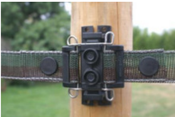
#BP32 avec 2 clips #RCLIPbl