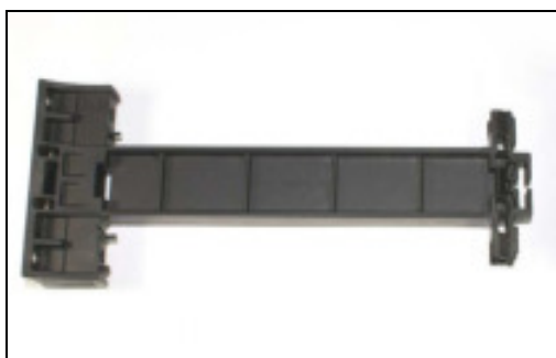
#13EX ( base)