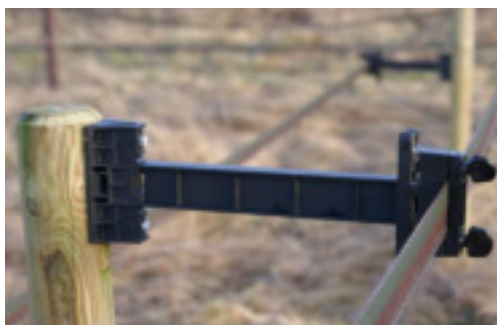
#13EX + #8bl