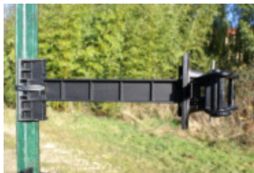
#13EX + #BP37