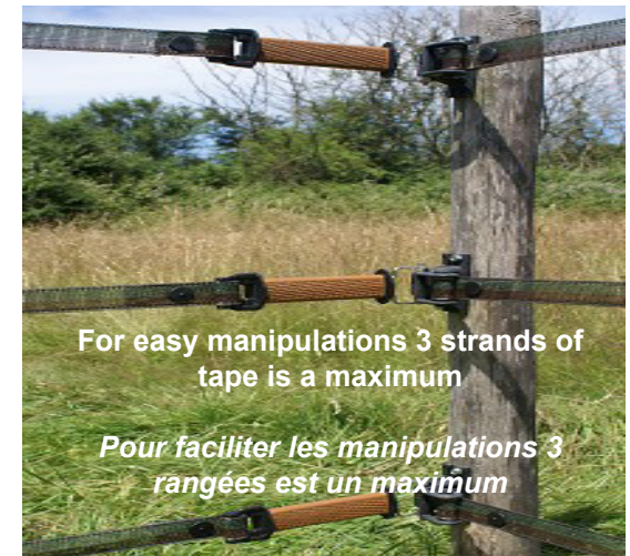
For easy manipulations 3 strands of tape is a maximum