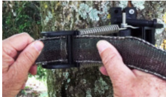
Now insert the tape back through the bigger slot. Repasser le ruban dans la plus grosse fente.