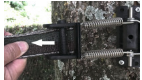
Pull the 2 tape sections together... Tirer sur les 2 rubans...