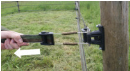
... to block the pin roller. ... pour bloquer le rouleau.