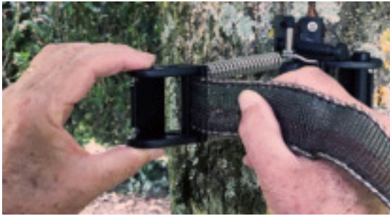
Insert the tape through the slot of the plastic buckle. Insérer le ruban à travers la fente de la boucle plastique.