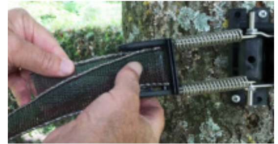
Press the two sections of tape together at the bottom of the buckle. The end of the tape is in the back. Poussez les 2 parties du rubans bien au fond de la boucle. La fin du ruban est à l'arrière.