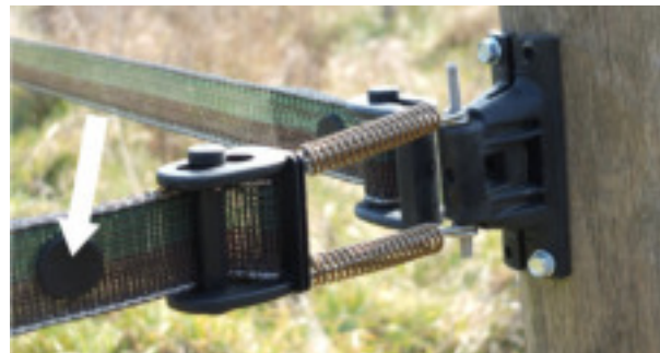
Use one round clip so the tape doesn't slip. Placer un CLIP punaise pour attacher les rubans.