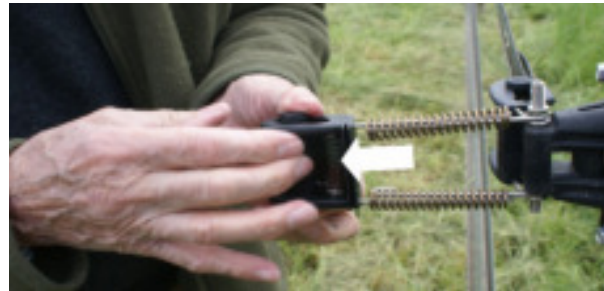
Pull the pin roller to slide and pinch the tapes. Tirer le rouleau pour pincer les 2 rubans.